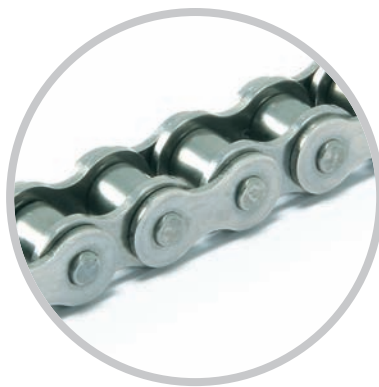
Łańcuchy ze stali nierdzewnej