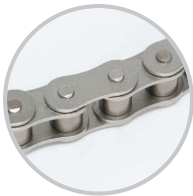
Łańcuchy z powłoką niklową